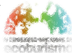
Granja Huerto Alegre – 1982 Parque Natural Sierras Tejeda, Almijara y Alhama - Granada